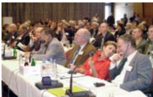
Sarrebruck, 6 novembre 2003 Saarbrücken, 6. November 2003

Diskussionsprozesse und Entscheidungen eingebunden werden möchte. Eine außerordentliche Versammlung der Mitgliedshochschulen fand am 6. November 2003 anlässlich der Wahl des neuen Präsidiums in Saarbrücken statt.