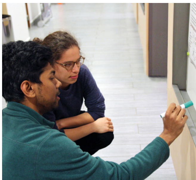
Atelier de recherche sur la thématique « Fluorescence markers for advanced microscopy » en avril aux Houches

versité Grenoble-Alpes et le Max-Planck-Institut für terrestrische Mikrobiologie Marburg, la manifestation s'est tenue aux Houches à la mi-avril. Dans un autre domaine, l'atelier interdisciplinaire consacré au « Management de la transformation digitale » organisé par l'Université de Lorraine et la Technische Universität Kaiserslautern a permis à des étudiant*es, chercheurs et chercheuses et industriels des deux pays d'explorer ensemble, quatre jours durant, les nouveaux horizons ouverts par l'enseignement et la recherche sur la transformation digitale (gestion de la technologie, innovations numériques, technologies digitales). Quarante jeunes