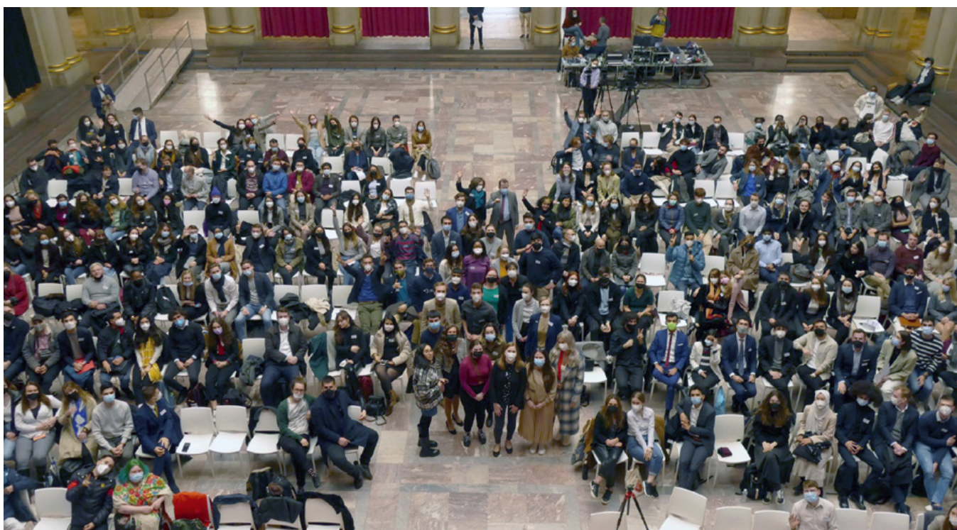
Participant*es à l'« European Student Assembly » en mars à Strasbourg

ouverture d'esprit et cette agilité durant leurs études. Concrètement, nous poursuivrons et renforcerons en 2023 notre engagement en faveur de l'entrepreneuriat, car la dynamique du Franco-German Tech-Lab mis en place en 2022 en coopération avec nos partenaires au salon VivaTech de Paris, était tout à fait exceptionnelle. Nous lançons donc dès à présent les invitations au salon VivaTech 2023 qui se déroulera à Paris du 14 au 17 juin, et nous réjouissons de toute nouvelle création d'entreprise.