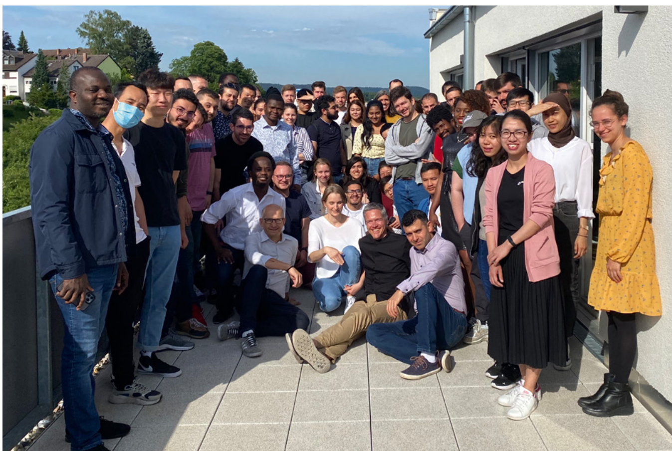
Participant*es à la manifestation scientifique « Management de la transition numérique » en juin à Kaiserslautern