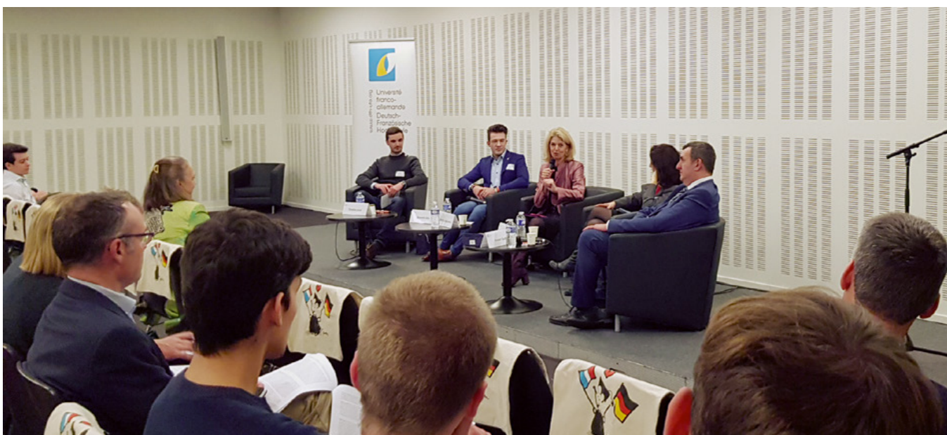
Forum Franco-Allemand : table ronde de l'UFA sur le thème « Alternance, formation duale et stages pratiques » en novembre à Strasbourg