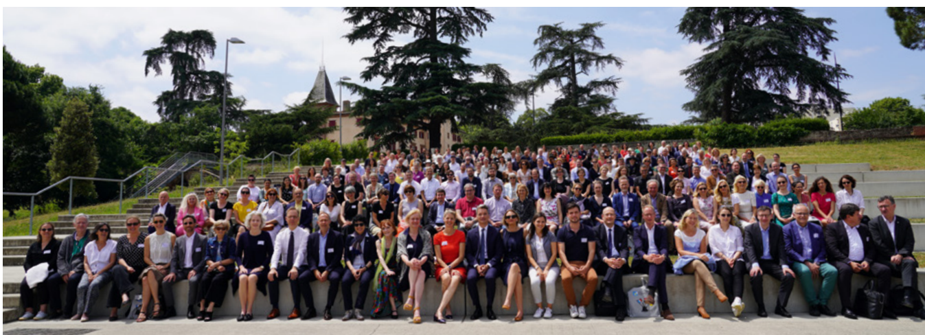
Assemblée des établissements membres de l'UFA en juin à Toulouse

Enfin, un partenariat avec ARTE Campus a permis de proposer une offre de test de cet outil aux responsables de programmes,