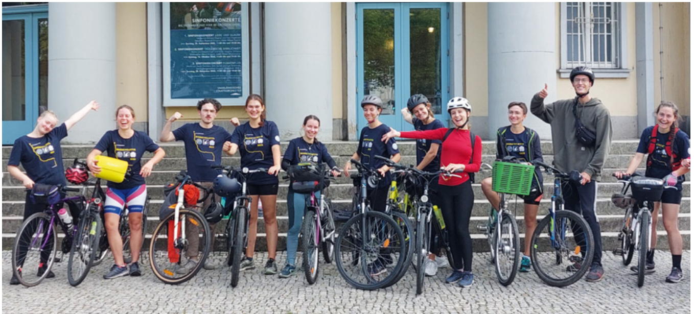
De Strasbourg à Sarrebruck : randonnée en bi(o)cyclette de l'Association des Alumni Franco-Allemands en Biologie soutenue par l'UFA entre les deux universités partenaires en septembre

Du 1er janvier au 30 juin 2022, la France a assuré la présidence du Conseil de l'Union européenne. L'UFA s'est saisie de cet événement pour s'engager plus fortement encore en faveur de l'Europe et de la coopération franco-allemande par une multitude d'actions. L'année 2022 a également marqué la fin des restrictions en lien avec la pandémie, une nouvelle phase pendant laquelle l'UFA a pu reprendre ses activités en présentiel tout en poursuivant le développement de formats numériques et hybrides ayant fait leurs preuves.