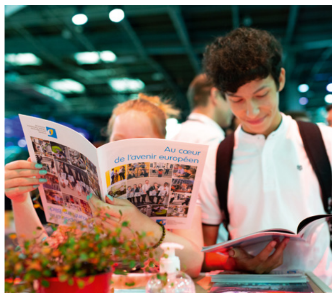
Salon Viva Technology, rendez-vous international de l'innovation numérique et des startups, en juin à Paris