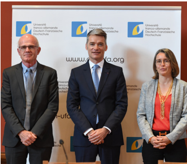
Lancement du Prix international en Santé planétaire dans le cadre des Dialogues franco-allemands pour l'Europe en mai à Lyon