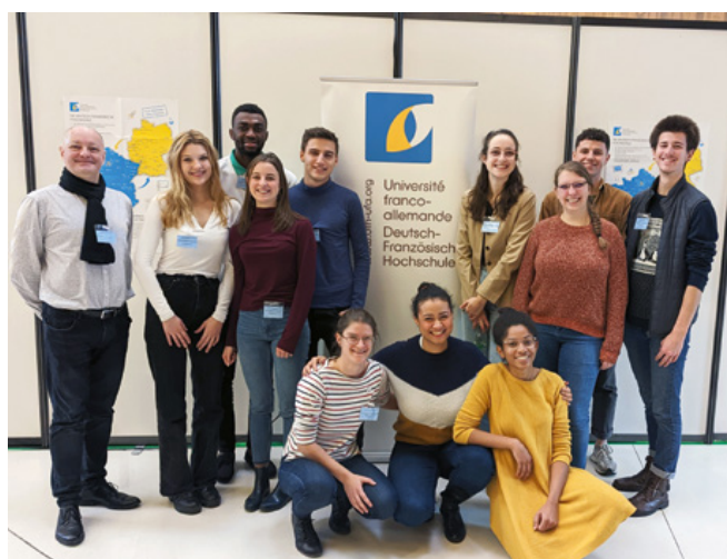
Réunion de la représentation étudiante de l'UFA en novembre à Strasbourg

Le Forum Franco-Allemand, qui s'est déroulé les 25 et 26 novembre à Strasbourg, joue un rôle clé dans le contact et le recrutement de nouveaux étudiants. La coopération de longue date avec le salon de l'Étudiant ainsi qu'un nouveau partenariat avec le salon de l'emploi franco-allemand Connecti ont mené à de nouveaux chiffres record cette année : près de 8 500 visiteurs et visiteuses se sont informé*es auprès des 210 établissements d'enseignement supérieur, institutions, organismes publics et entreprises présents sur les possibilités