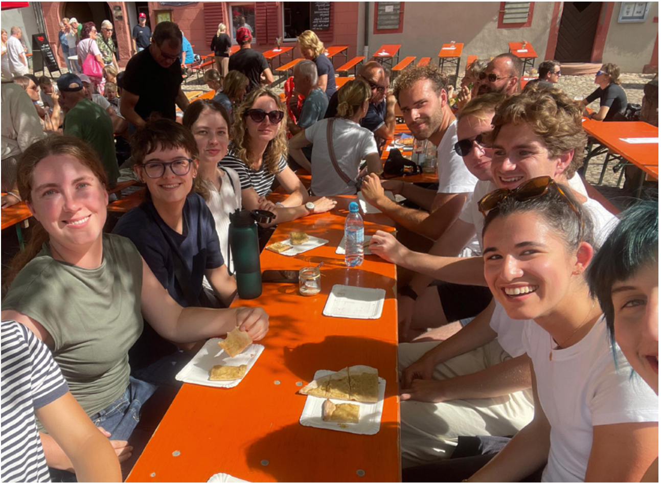
Hüttenwochenende des Alumnivereins des Doppelmasters Deutsch-Französisches Recht e.V. (Freiburg/Straßburg) im September 2025 – Gemeinsamer Besuch des Zwiebelkuchenfestes in Burkheim

Die Alumnivereine einzelner DFH-Studiengänge stellen eine wichtige