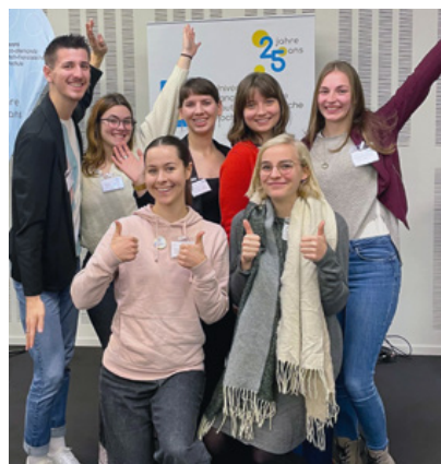
Die Studierendenvertretung der DFH

Warum sich Studierende für einen bi- oder trinationalen Studiengang entscheiden? Wir haben nachgefragt: „Mit dem integrierten Auslandsjahr und einem Doppelabschluss werde ich interessant für Arbeitgeber. Die vielfältigen Studieninhalte und Lernmethoden, die interkulturelle Sensibilisierung und die finanzielle Unterstützung in der Mobilität machen das Studium einzigartig“, betont Andréa, Masterstudentin Deutsch-Französische Studien. Informatik-Student Aboubacar schätzt die engmaschige Betreuung, das Eintauchen in die Kultur des Partnerlandes und die gute Organisation.