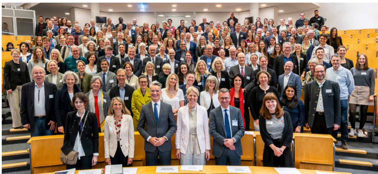
Vertreter*innen der Mitglieds- und Partnerhochschulen des DFH-Netzwerks auf der Jahresversammlung im Mai in Passau

Derzeit fördert die DFH 199 INTEGRIERTE BI- UND TRINATIONALE STUDIENGÄNGE sowie 34 INTERNATIONALE DOKTORANDENPROGRAMME , die an 135 STANDORTEN und in einer großen Bandbreite an Fachrichtungen angeboten werden: von Natur- und Ingenieurwissenschaften über Geistes- und Sozialwissenschaften, Rechts- und Wirtschaftswissenschaften bis hin zu Lehrkräftebildung.