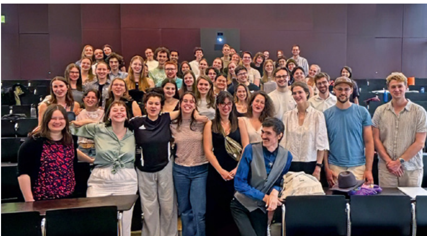
2025 nahmen 65 Studierende und Absolvent*innen der DFH am jährlichen Meet-up teil

Studierende erhalten auf diesem Weg Zugang zu einem wichtigen Netzwerk sowie Unterstützung von Gleichgesinnten.