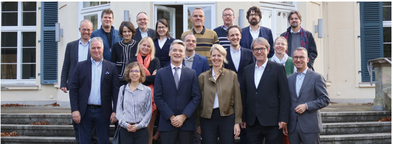
Der neue Wissenschaftliche Beirat der DFH

Arbeit der DFH Früchte trägt: Erstmals bewarben sich auch Hochschullehrende, die selbst ein durch die DFH gefördertes Programm absolviert haben. Die DFH gratuliert und freut sich auf eine engagierte Zusammenarbeit!