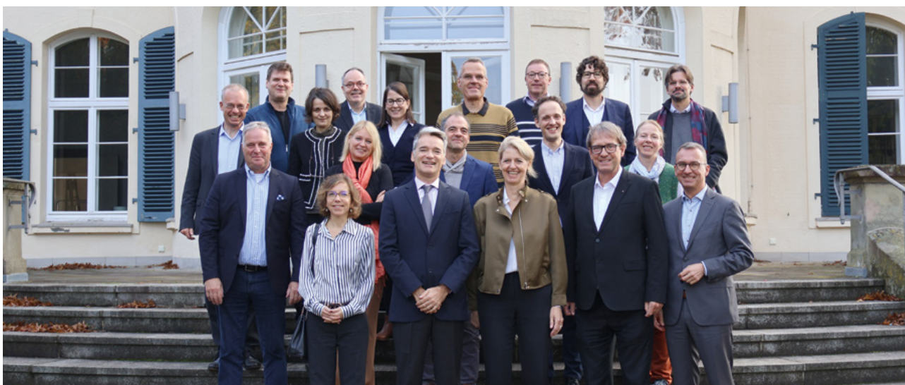
La nouvelle commission scientifique de l'UFA

plusieurs des candidat-es avaient déjà suivi un programme soutenu par l'UFA. L'UFA adresse ses félicitations aux membres élus et se réjouit d'une collaboration constructive.