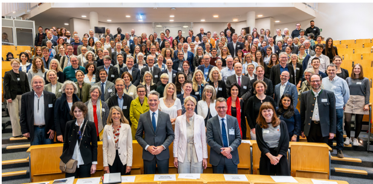
Représentant-es des établissements membres et partenaires du réseau de l'UFA lors de leur assemblée annuelle en mai à Passau

Actuellement, l'UFA soutient 199 CURSUS INTÉGRÉS BI- ET TRINATIONAUX ainsi que 34 COLLÈGES DOCTORAUX INTERNATIONAUX , proposés sur 135 SITES , dans un très grand nombre de disciplines : sciences, sciences de l'ingénieur, sciences humaines et sociales, économie et gestion, droit ou encore formation des enseignant-es.