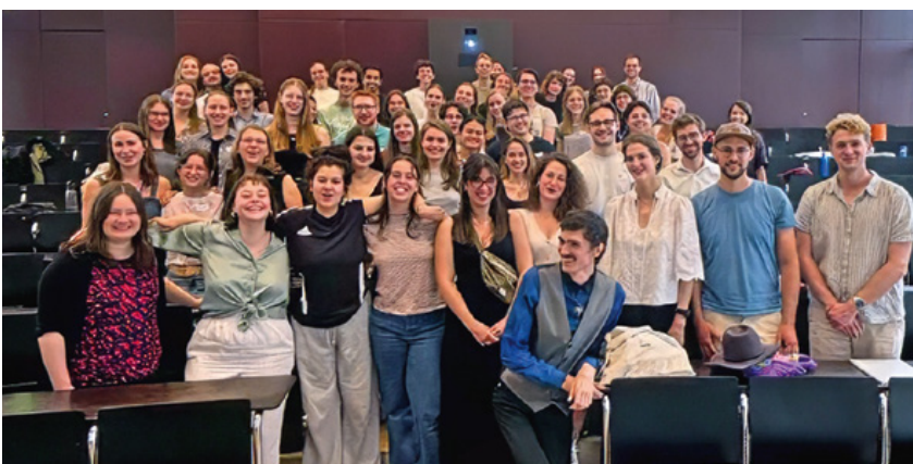
En 2025, 65 étudiant-es et diplômé-es de l'UFA ont participé au meet-up annuel

de bénéficier du soutien de personnes partageant une expérience franco-allemande commune.