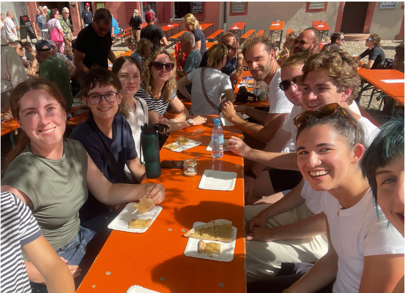
Week-end en gîte organisé par l'association des diplômé-es du double master en droit franco-allemand (Fribourg/Strasbourg) en septembre 2025 – moment convivial lors de la fête de la tarte à l'oignon de Burkheim

Les associations de diplômé-es des différents cursus de l'UFA constituent un pilier important de