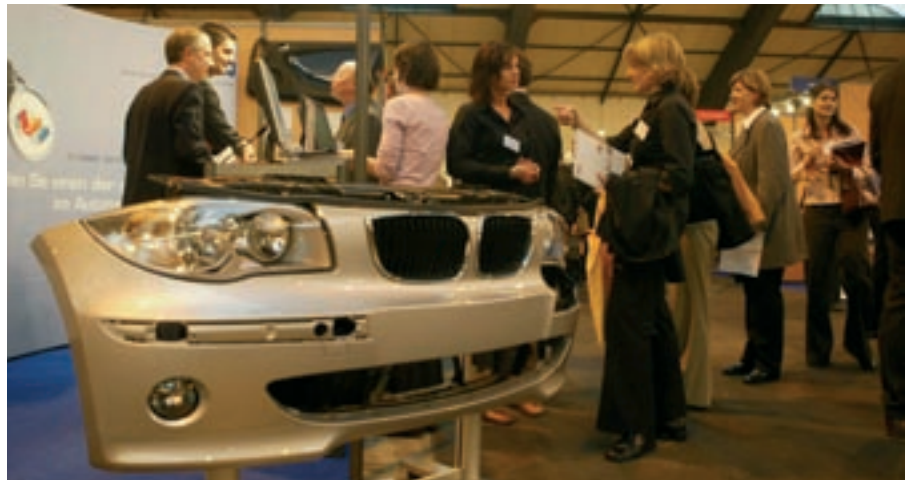
Deutsch-Französisches Forum/Forum Franco-Allemand

Dabei ist Deutsch die meist gesprochene Muttersprache in der EU und neben Französisch oder Englisch selbst eine wichtige Fremdsprache. Deutschland ist außerdem europaweit eine der wichtigsten Wirtschaftsnationen, wobei Nachbar Frankreich größter Wirtschaftspartner ist. „Größere Unternehmen denken deshalb inzwischen um und auch kleinere, innovative Firmen schwenken auf diesen Weg ein, weil sie sehen, dass Mitarbeiter mit einer binationalen Ausbildung die