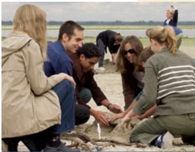
Thematische Sommerschule/Ecole d'été thématique, Saint-Valéry-sur-Somme

A l'avenir, l'UFA ne se contentera pas uniquement d'accroître considérablement ses investissements dans la coopération binationale en matière de recherche. La formation doctorale structurée – au centre du programme de soutien – sera elle aussi étendue. A compter de 2007, l'UFA attribuera des indemnités d'expatriation pouvant atteindre 1.300 euros par mois à des doctorants dans le cadre de ces coopérations franco-allemandes. Précédemment, l'UFA avait augmenté les aides à la mobilité des doctorants. « Nous souhaitons donner un coup de pouce au troisième niveau du processus de Sorbonne-Bologne et faciliter l'internationalisation de la formation doctorale dans les deux pays », précise le Président de l'UFA, Dieter Leonhard.