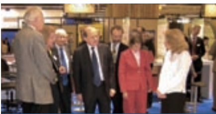
Forschungsmesse/Salon de la recherche